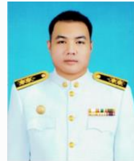
ผู้รับผิดชอบ